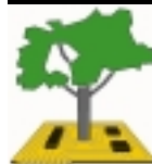
UMWELT-TECHNIK-Preis DES RHEIN-SIEG-KREISES

Am 9. Juli fand die Preisverleihung zum Umwelt-Technik-Preis statt. Der Wettbewerb richtet sich an die hier ansässige Wirtschaft und zeichnet umweltverbessernde Leistungen aus. Ein ausführlicher Bericht über die Preisträger aus Sankt Augustin und Eitorf, sowie den Unternehmen, die weiterhin ausgezeichnet wurden, finden Sie im Heft.