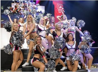
Danceteam Telekom Baskets Bonn

www.telekom-baskets-bonn.de/team/baskets-danceteam