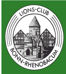
Lions Club Bonn

www.telekom-baskets-bonn.de/team/baskets-danceteam