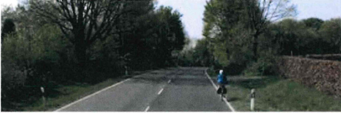
Abb. 9: B56, Fehlender Verkehrsraum für Radfahrer