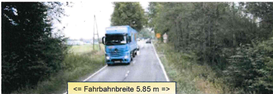
Abb. 11: B56 zwischen Krahwinkel und Heister; deutlich zu geringe Fahrbahnbreite der B 56