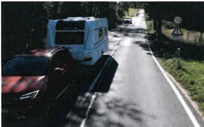
Abb. 12: B 56 Nahe Heister; ebenfalls deutlich zu geringe Fahrbahnbreite der B56